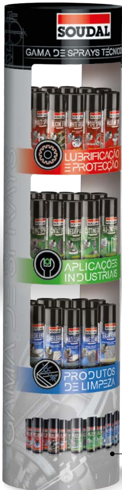
EXPOSITOR DE CHÃO Código: 154651 Dimensões. cm 38ø x157(H) Conteúdo:12 latas/prateleira