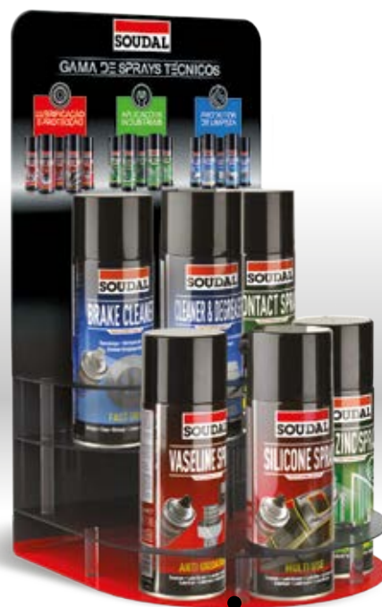
EXPOSITOR DE BALCÃO Código: 154646 Conteúdo: 6x400ml